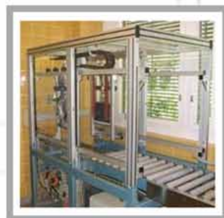
Dispozitiv de sterilizare loturi