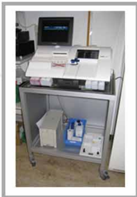
Cărucior pentru dispozitivul de analiză medicală