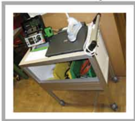
Cărucior de transport