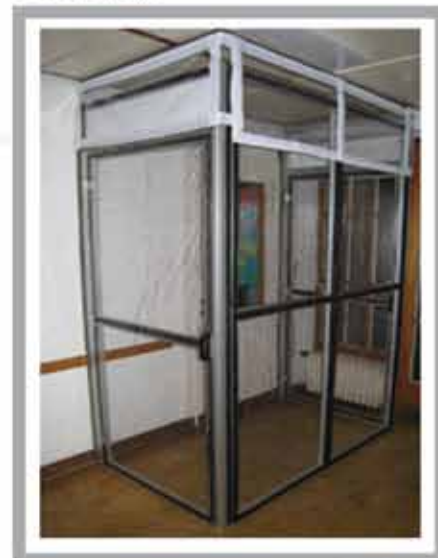
Sistem de separare pentru protecția împotriva prafului Se poate completa modular, cu utilizări multiple, de ex. ca despărțitoare de zone de construcție