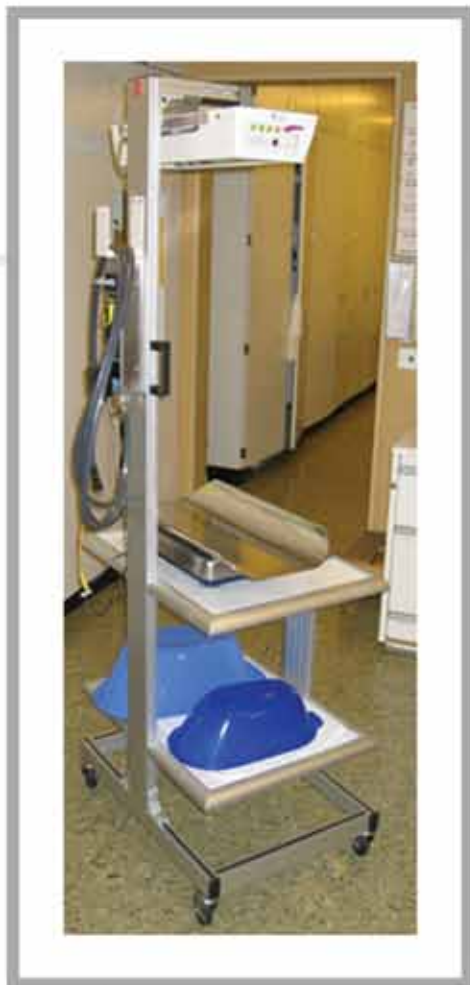
Stelaj pe role pentru cântarul de copii cu lampă de încălzire