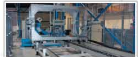
Mașină de testare aripi avion