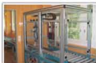
Dispozitiv de sterilizare loturi