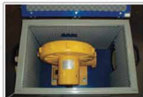
Protecție acustică pentru ventilator