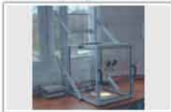
Protecție dispozitiv laborator