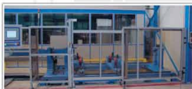
Cadru pentru spațiu de debavurare cu geam de siguranță