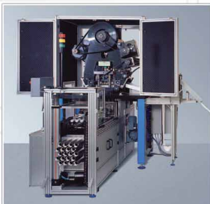
Automat de ștanțat cu carcasă acustică