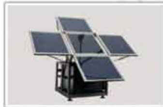
Stație de energie solară