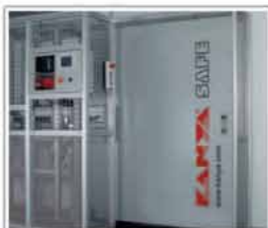
Dispozitiv de siguranță cu ușă automată