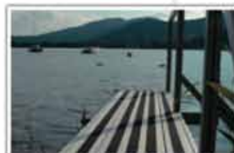
Doc pentru ambarcațiuni