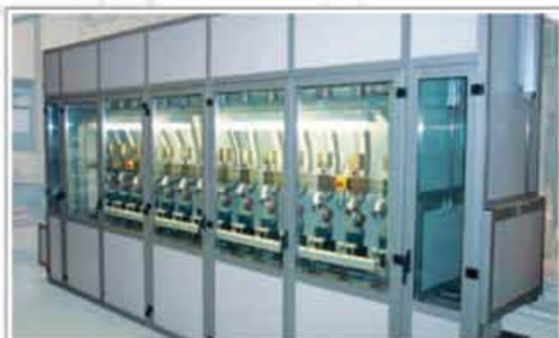
Cabină de testare