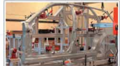
Dispozitiv de prindere și măsurare