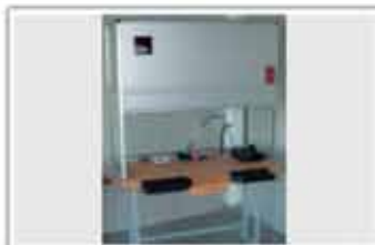
Post de lucru cu capelă