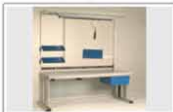
Post de lucru