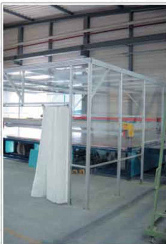
Cabina de protecție împotriva prafului