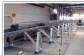
Raft depozitare obiecte lungi