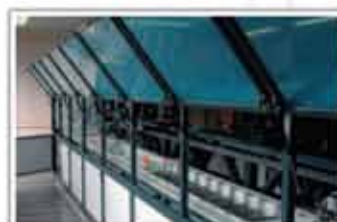
Instalație de poleire automată