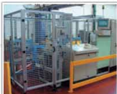
Zonă de siguranță