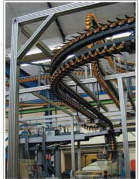
Sistem de manipulare a ziarelor