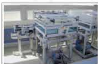
Echipament de umplere automat