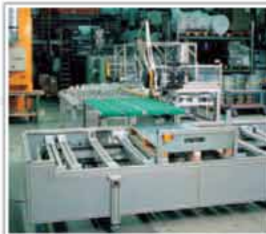
Instalație de paletizare automată