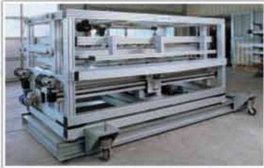
Mașină de debitat transversal și longitudinal