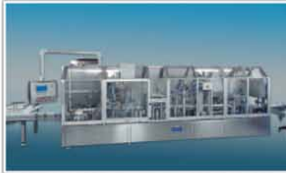
Construcție de umplere