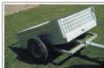
Remorcă pentru grădină