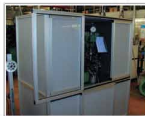
Cabină de protecție acustică