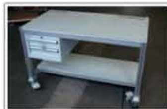
Birou de lucru mobil