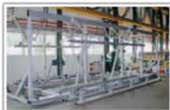
Cadru de asamblare vagoane