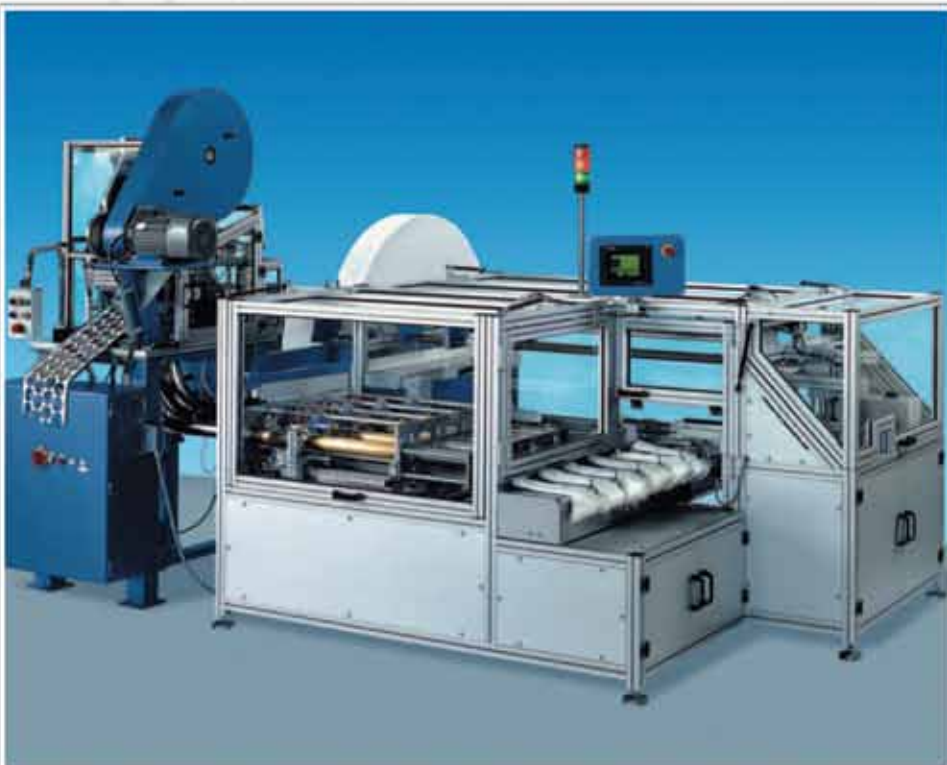
Automat de ștanțare și ambalare