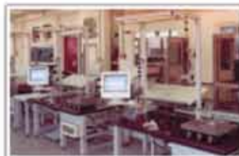
Post de lucru pentru instalări