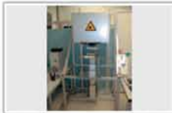
Echipament laser pentru cercetare