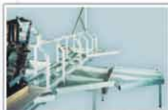
Model de cercetare avion de luptă